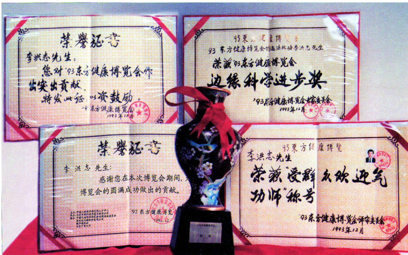
李洪志先生获 93 年北京东方健康博览会唯一最高奖「边缘科学进步奖」和大会的「特别金奖」、「最受欢迎的气功师」。

在海外，李先生及法轮大法荣获许多国家和各政府的褒奖达 900 多项。正如美国德州休斯顿市市长奖状中所写：「法轮大法超越文化，超越种族界限，将宇宙真理播向世界各个角落，架起了东西方交流的桥梁。他的教导打动了无数人的心灵，赢得了举世赞誉……」