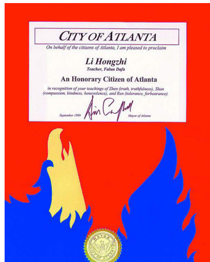
1999/9/3 美国亚特兰大市市长宣布：李洪志，为该市荣誉公民。

在海外，李先生及法轮大法荣获许多国家和各政府的褒奖达 900 多项。正如美国德州休斯顿市市长奖状中所写：「法轮大法超越文化，超越种族界限，将宇宙真理播向世界各个角落，架起了东西方交流的桥梁。他的教导打动了无数人的心灵，赢得了举世赞誉……」