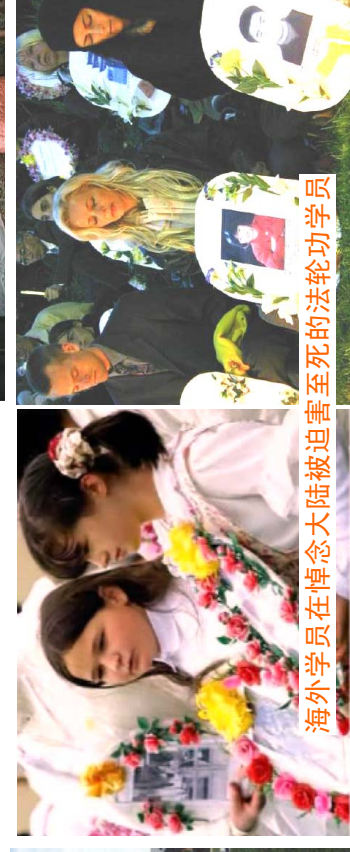
海外学员在悼念大陆被迫害至死的法轮功学员