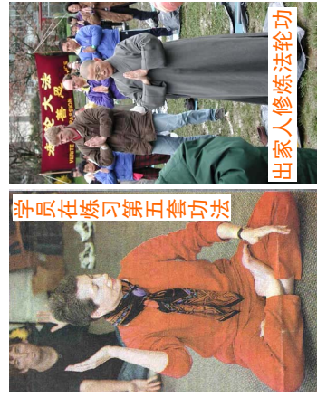
学员在练习第五套功法

在海外，四年来，人们并没有因为谎言而远离法轮功。相反，法轮功在世界各地深受喜爱，至今已传遍世界60多个国家，受各国政府褒奖已超过1000多项，被誉为“高德大法”。《转法轮》等书已被译成几十种语言在世界各地发行。