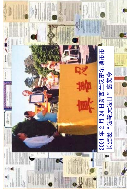
2001年2月24日新西兰汉密尔顿市长颁发“法轮大法日”褒奖令