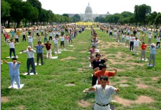
华盛顿 DC 国会大草坪集体炼功 呼吁紧急援救大陆受迫害学员(1999.7.20)