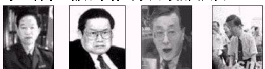
原公安部陪练长贾春旺 公安部陪练长周永康 原公安部陪练长刘京 原北京市公安局局长

北京市积水潭医院 新华社网络中心 北京市急救中心 事件当事人及亲友等 取证名单（部分事件当事人与相关人员）：