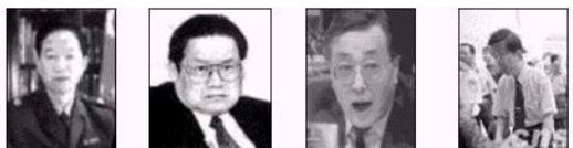
原公安部陪练长贾春旺 公安部陪练长周永康 原公安部陪练长刘京 原北京市公安局局长

北京市积水潭医院 新华社网络中心 北京市急救中心 事件当事人及亲友等 取证名单（部分事件当事人与相关人员）：