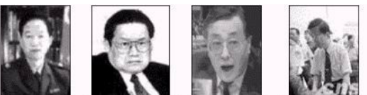
原公安部陪练长贾春旺 公安部陪练长周永康 原公安部陪练长刘京 原北京市公安局局长

北京市积水潭医院 新华社网络中心 北京市急救中心 事件当事人及亲友等 取证名单（部分事件当事人与相关人员）：