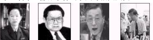
原公安部陪练长贾春旺 公安部陪练长周永康 原公安部陪练长刘京 原北京市公安局局长

北京市积水潭医院 新华社网络中心 北京市急救中心 事件当事人及亲友等 取证名单（部分事件当事人与相关人员）：