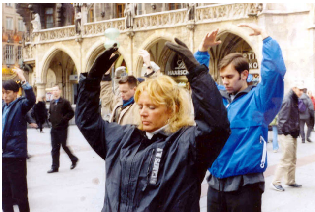
尤素拉和她的儿子(着蓝衣者)在炼功