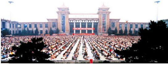
沈 阳 万 人 炼 功

在当今这个现实的社会里，无论任何人给您什么，他都想求得回报。而我们给您这份材料不求您什么，只为请你正面了解一下关于法轮功的真实情况。在电视、报纸等传媒被严密垄断的情况下，大陆老百姓是很难听到、看到关于法轮功的真实报导。传媒的造假宣传从没有让法轮功受益者说一说。真心地希望您，辽宁省的父老乡亲，倾听一下就在您身边的法轮功学员，讲述的他们自己和朋友的亲身经历。