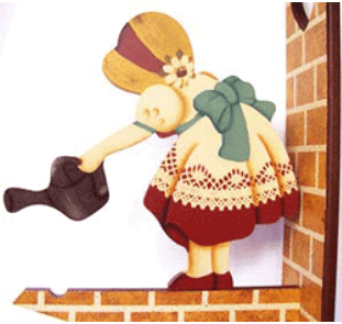
栽善根 开善花 结善果

电视上还整天宣传说“炼法轮功死了 1400 人”，可是作为一个生长在辽宁的人，相信我们许多人都见证过当初法轮功在辽宁蓬蓬勃勃传播的大型炼功场面，那么人们为什么不想一想，为什么法轮功从 92 年传出到 99 年的 7 年间，都从来没有听说过这些如同“妖魔鬼怪”的可怕事件，没听说过一个死亡案例，唯独在 99 年当权者要镇压后，这些事件就层出不穷地，根据当权者需要隔一段时间就冒出来一个呢？当初在辽宁，法轮功的炼功人可以说遍及各个城市乡村，那为什么这些事情您只能在当局的宣传媒体上见到，而从没有在自己身边的炼