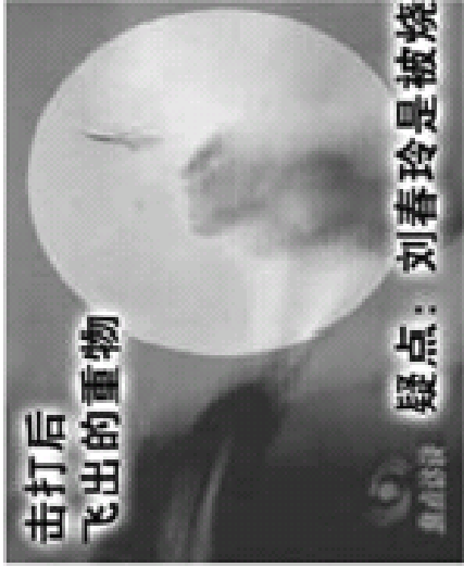
击打后 飞出的重物