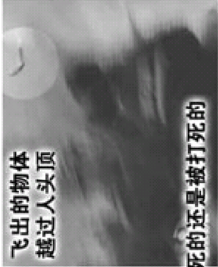
飞出的物体 越过人头顶