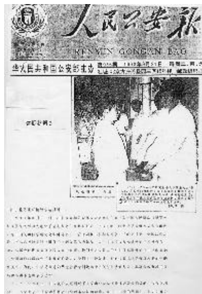
（圖片：1993年9月21日中國公安部主辦的《人民公安報》對法輪功的正面報導）