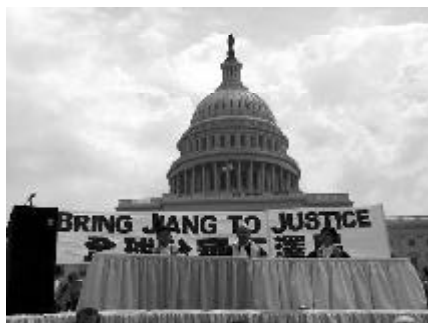
（圖片：對江澤民的模擬審判，2003年7月，美國華盛頓國會山前）