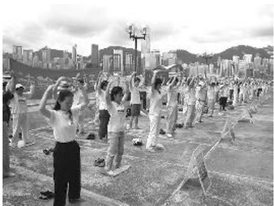
（上圖：北歐，中圖：紐約，下圖：香港， 來源：明慧網）