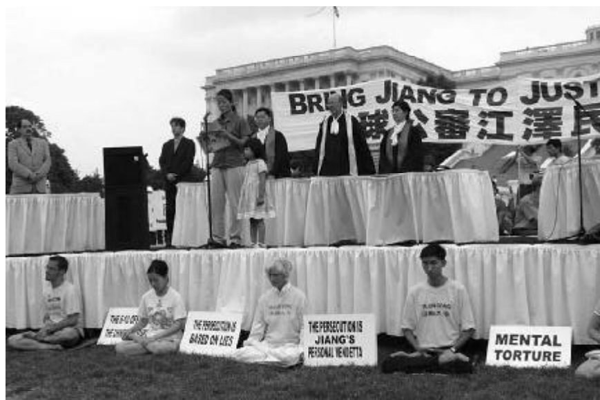
（美國華盛頓國會山前，2003年7月）