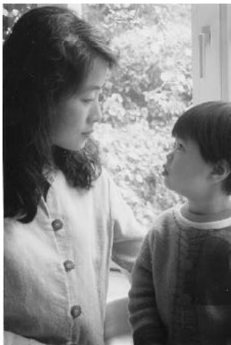
（圖：小法度：「媽媽，我要爸爸！」）