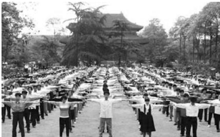
（圖片：李洪志先生於1994年5月在成都舉辦中國法輪功傳授班。從此法輪功在當地迅速傳開。至1999年初僅成都已有幾十萬人在修煉。每天清晨學員們都自發地來到住家附近的煉功點，參加晨煉。中國，成都。來源：《正法之路圖片展》明慧網）