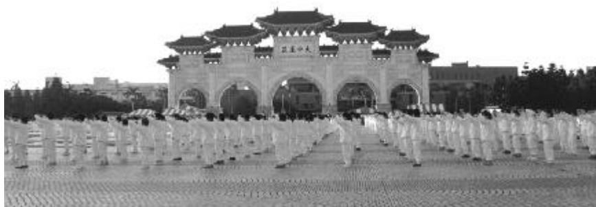
（圖片：臺灣法輪功學員集體晨煉，來源：明慧網）