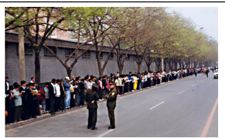
法轮功学员没有阻塞交通静静的站立等后十几个小时离开时把环境清理的干干净净

上访的起因是 4 月 23 日天津殴打、抓捕法轮功学员造成的。早在 96 年，把持政法、公安部门的罗干就开始刁难法轮功，因为修炼法轮功的人多，而且传播很快，江泽民就认为法轮功在与它争夺群众。出于嫉妒和恐惧，江罗一伙先是利用何作庥等人诽谤宣传挑起事端，然后指使公安抓人打人激化矛盾，促成群众上访解决问题，再以此大做文章。因为罗干设下圈套，事先封闭各路口唯独留下中南海一条路，公安刻意诱导学员分为两路把中南海围成一圈形成所谓的“包围中南海”进行栽赃陷害，它们滥用手中的权力和人民对政府的信任，控制所有新闻媒体把 1999 年 4 月 25 日和平上访变成了日后对法轮功发动蓄谋已久的