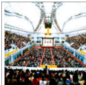
2002. 12. 30 台湾法轮功心得交流会，有 7000 多人参加了这次盛会。