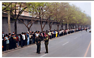
法轮功学员没有阻塞交通静静的站立等后十几个小时离开时把环境清理的干干净净

上访的起因是 4 月 23 日天津殴打、抓捕法轮功学员造成的。早在 96 年，把持政法、公安部门的罗干就开始刁难法轮功，因为修炼法轮功的人多，而且传播很快，江泽民就认为法轮功在与它争夺群众。出于嫉妒和恐惧，江罗一伙先是利用何作庥等人诽谤宣传挑起事端，然后指使公安抓人打人激化矛盾，促成群众上访解决问题，再以此大做文章。因为罗干设下圈套，事先封闭各路口唯独留下中南海一条路，公安刻意诱导学员分为两路把中南海围成一圈形成所谓的“包围中南海”进行栽赃陷害，它们滥用手中的权力和人民对政府的信任，控制所有新闻媒体把 1999 年 4 月 25 日和平上访变成了日后对法轮功发动蓄谋已久的