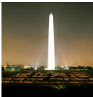
2003. 7. 27 华盛顿 DC 法轮功学员排字“法正天地”。

扮演重要角色。除了法轮功事件，还包括“六四”事件和一些重大经济犯罪，及中美国际事件。