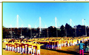
澳大利亚雪梨集体炼功