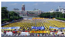
2003. 11. 15 日台北总统府前万人静坐声援控诉江泽民