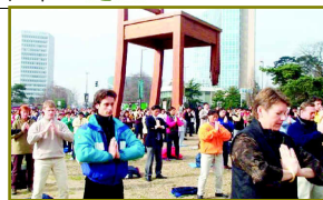
瑞士联合国总部前集体炼功

营口的朋友：在世界上，有越来越多人走上法轮功的修炼道路，庶农工商、全家修炼者也都不在少数。