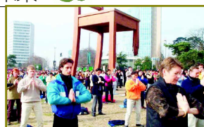
瑞士联合国总部前集体炼功

营口的朋友：在世界上，有越来越多人走上法轮功的修炼道路，庶农工商、全家修炼者也都不在少数。