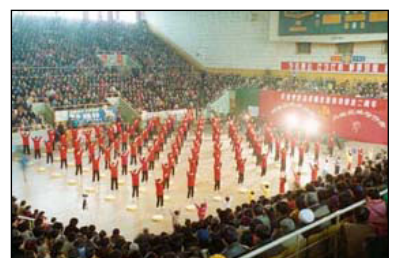
1998年济南法轮大法修炼心得交流会