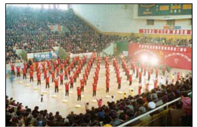
1998年济南法轮大法修炼心得交流会