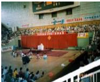
1994年6月21日至6月28日，济南第二期传授班在山东省济南市皇厅体育馆举办。

法轮大法的传出，给我们齐鲁这块文明古地带来了惊喜。1992年11月16日至25日和1993年5月8日至17日，法