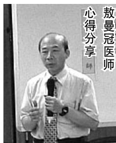
敬曼冠医师心得分享

大家在交换这些天的心得体会时，都觉得自己太晚遇到法轮功了，如果再早一些时间就来炼功不知道有多好。