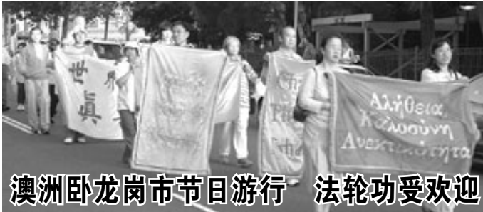
澳洲卧龙岗市节日游行 法轮功受欢迎

【明慧网】2004年10月23日下午，澳洲卧龙岗市（Wollongong）市 Viva La Gong 节的节日游行开始。由于法轮功学员往年曾有参加游行，节日庆祝活动组织者对法轮功的游行队伍喜爱有加，力邀法轮功学员参与今年的游行。