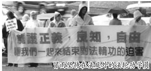
冒雨坚持在法庭外的法轮功学员

受11名法轮功学员委托，将一份起诉状呈递给新西兰奥克兰市高等法院，以民事诉讼形式控告迫害法轮功的元凶江泽民及其追随者对原告法轮功学员在中国探亲、访问时进行抓捕和人身虐待的罪行，罪名包括群体灭绝、酷刑、非法逮捕等。