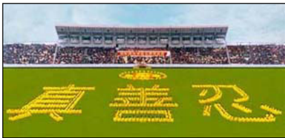
气势磅礴的“真善忍”组字 四川省乐山，98年

独裁者江 XX 利用手中大权践踏法律，迫害法轮功，连篇的谎言，恶毒的中伤，从我的亲身经历，我坚信谎言会被揭穿，真相总会大白于天下。