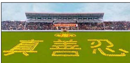
气势磅礴的“真善忍”组字 四川省乐山，98年

独裁者江 XX 利用手中大权践踏法律，迫害法轮功，连篇的谎言，恶毒的中伤，从我的亲身经历，我坚信谎言会被揭穿，真相总会大白于天下。