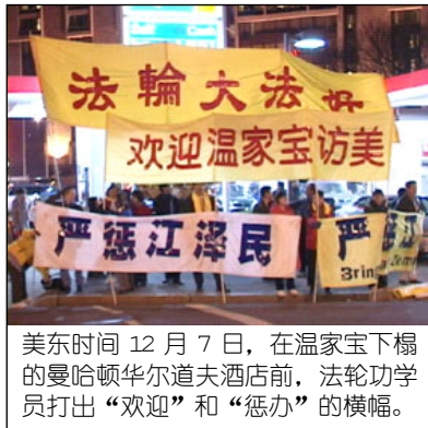
美东时间 12 月 7 日，在温家宝下榻的曼哈顿华尔道夫酒店前，法轮功学员打出“欢迎”和“惩办”的横幅。

法轮功作为一个精神信仰，追求的是道德和修炼境界的升华。在法轮功学员看来，真正能彻底地使人们获得永恒幸福的是对真善忍的认