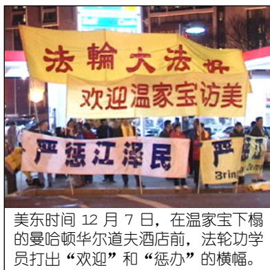
美东时间 12 月 7 日，在温家宝下榻的曼哈顿华尔道夫酒店前，法轮功学员打出“欢迎”和“惩办”的横幅。

法轮功作为一个精神信仰，追求的是道德和修炼境界的升华。在法轮功学员看来，真正能彻底地使人们获得永恒幸福的是对真善忍的认