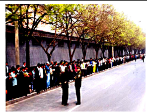
法轮功学员没有阻塞交通，静静的站立等候十几个小时，离开时把环境清理的干干净净。

4月25日当天，上万名闻讯而来法轮功群众没有口号、没有标语，安静而有秩序的在北京国务院信访办等候了十几个小时。总理朱镕基接见了学员代表，令天津公安局放