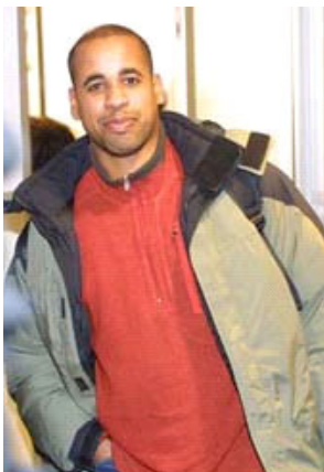
2002年2月，斯特灵在天安门广场打出“法轮大法好”横幅后，从北京回到纽约肯尼迪机场。