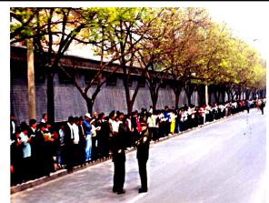
法轮功学员没有阻塞交通，静静的站立等候十几个小时，离开时把环境清理的干干净净。

4月25日当天，上万名闻讯而来法轮功群众没有口号、没有标语，安静而有秩序的在北京国务院信访办等候了十几个小时。总理朱镕基接见了学员代表，令天津公安局放