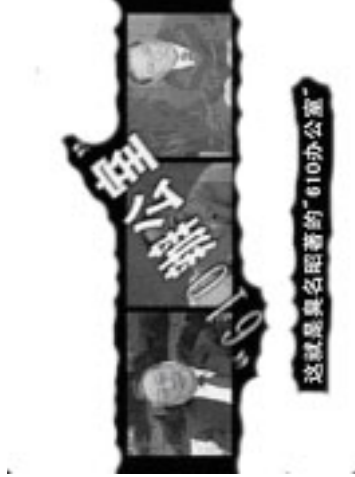
“风雨天地行”之“风雨” 20

亚洲，在十多个国家和地区拥有众多的学炼者。单台湾一地，99年江泽民集团镇压法轮功后，台湾的法轮功学员人数却增加到数十万。北美洲的美国和加拿大，澳洲和新西兰，欧洲从冰岛到希腊，从法国到乌克兰，法轮功是西方世界里一道独特的风景线。南美洲和非洲同样可以看到法轮功。