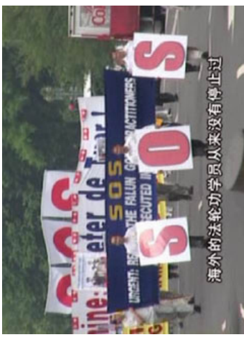
“风雨天地行”之“同心” 26

国际教育发展组织早在01年8月联合国的会议上就提交了天安门自焚案的分析录像带，并明确指出该事件是由江泽民当局精心策划的谋杀。2003年11月，分析自焚案重重疑点的英文纪录片《伪火》，以其严谨实的风格和对黑幕的曝光获得第51届哥伦布国际电影节荣誉奖。