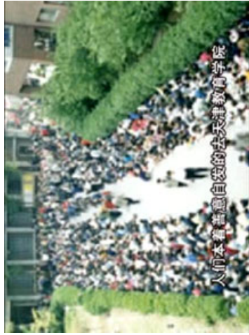
“风雨天地行”之“风雨” 16

1998年下半年，由前人大委员长乔石所主持的对法轮功的官方调查得出的结论是法轮功“于国于民有百利而无一害”。可是，1999年4月11日，何祚枬在天津教育学院发行的一份全国性期刊上又一次发表文章，说炼法轮功会使人得精神病，并暗喻法轮功会像义和团一样。