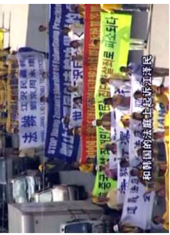
“风雨天地行”之“审判” 30

两千多年前，古罗马暴君尼禄故意纵火焚烧罗马城，然后嫁祸基督徒。为了进一步煽动罗马人对基督徒的仇视，一些理论家将那些无辜的基督徒描绘为迷信，反社会，反人类，甚至怀有政治目地。善良的基督徒被投入竞技场，被猛兽活生生的咬死，而被谎言欺骗了的愤怒的罗马人面对这