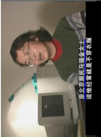
“风雨天地行”之“荡浊” 7

截止2004年3月，法轮功学员已在比利时，美国，西班牙，台湾，德国，和韩国的法庭上起诉江泽民。而且，包括江泽民、罗干、周永康在内的45人因为积极指挥和参与迫害法轮功的罪行，已被列入加拿大皇家骑警的监视名单。其中任何人一旦进入加拿大就将受到调查。