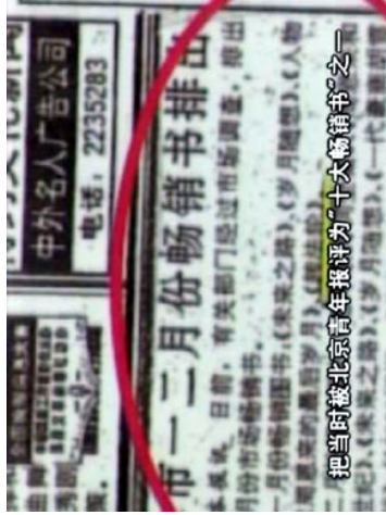
“风雨天地行”之“风雨” 13

文章中对法轮功毫无根据的污蔑，在社会上造成了很坏的影响。很多的学员来到天津教育学院，希望能用亲身经历澄清事实。然而，4月23日，300多名警察粗暴殴打、驱赶人群，45位学员被抓。天津市政府还告诉上访学员，这件事天津管不了，要说明情况就要到上一级——北京的中央政府。