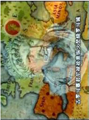
“风雨天地行”之“荡浊” 1

01年11月20日来自12个国家的36名西人修炼者来到天安门广场和平请愿。02年10月24日，加拿大国会一致通过声援法轮功议案，要求中国释放被监禁的法轮功学员。02年7月24日美国国会以420票赞成，0票反对，一致通过第188号决议案，敦促中国江泽民政府停止迫害法轮功。