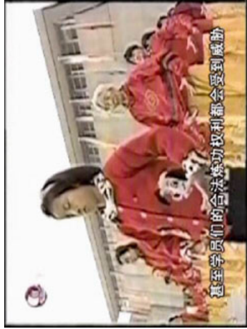
“风雨天地行”之“风雨” 15

治国的才能或是深厚的资历，而是凭借政治投机，在89年的六四天安门事件中率先积极响应强硬压制手段而获得赏识的。其对权力的极大欲望和不安全感，使得他对于朱镕基总理因为妥善处理四·二五事件而赢得的国际声誉，和法轮功及其创始人在中国的广受欢迎都感到极为妒忌。