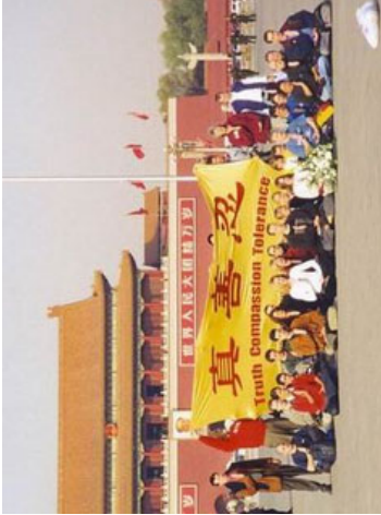
“风雨天地行”之“同心” 28

公元2001年1月23日一场发生在天安门广场的自焚之火，经过中国媒体的反复渲染迅速传遍全世界，其效果和罗马古城大火惊人的相似。自焚者被一口咬定为法轮功学员。声情并茂的揭批中，要刻意煽动的是对法轮功的仇恨。也许中央电视台的运气特别好，获得了难得的近距离拍摄“机会”