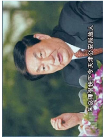
“风雨天地行”之“风雨” 18

特别是法轮功，因其在极短时间内迅速传播，更引起一些人格外的关注。96年6月17日，光明日报发表评论文章，把当时被北京青年报评为“十大畅销书”之一的《转法轮》当作“伪科学”进行批判。一个月后，中宣部管辖的新闻出版署以“宣扬迷信”为由，禁止出版发行法轮大法书籍。