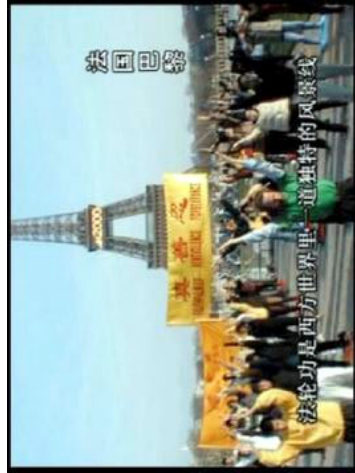
“风雨天地行”之“清音” 11

亚洲，在十多个国家和地区拥有众多的学炼者。单台湾一地，99年江泽民集团镇压法轮功后，台湾的法轮功学员人数却增加到数十万。北美洲的美国和加拿大，澳洲和新西兰，欧洲从冰岛到希腊，从法国到乌克兰，法轮功是西方世界里一道独特的风景线。南美洲和非洲同样可以看到法轮功。