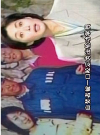
“风雨天地行”之“荡浊” 3

公元2001年1月23日一场发生在天安门广场的自焚之火，经过中国媒体的反复渲染迅速传遍全世界，其效果和罗马古城大火惊人的相似。自焚者被一口咬定为法轮功学员。声情并茂的揭批中，要刻意煽动的是对法轮功的仇恨。也许中央电视台的运气特别好，获得了难得的近距离拍摄“机会”