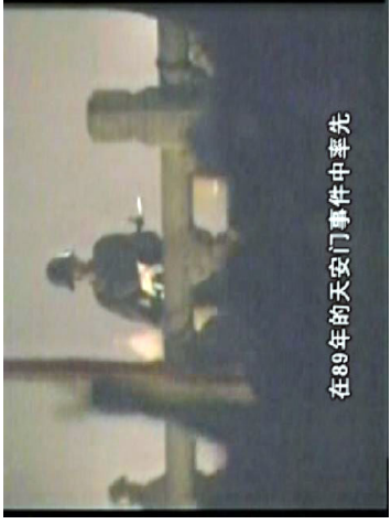
“风雨天地行”之“风雨” 22

法轮大法，也叫法轮功，92年5月由李洪志先生推出。修炼者以五套简单柔和的功法修炼净化身体，以“真、善、忍”为指导来提升心灵与精神，通过对身心的全面修行从而达到身体健康，道德与精神升华。98年，北京、武汉、大连地区及广东省的医学界对近三万五千名法轮功学员所做