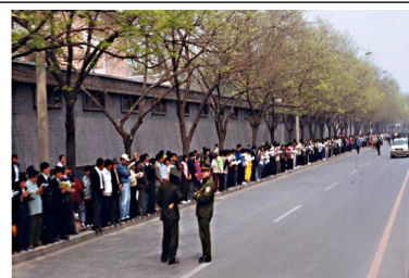
学员没有标语口号没有阻塞交通

早在 1996 年，把持政法、公安部门的罗干就开始刁难法轮功，因为修炼法轮功的人多，而且传播很快，江泽民出于嫉妒和恐惧，认为法轮功在与它争夺群众。江罗一伙先是利用何作庥等人诽谤宣传挑起事端，后于 99 年 4 月 23 日指使天津公安殴打、抓捕 40 多名法轮功学员，公安部介入天津市，并告知没有北京的授权不放人，天津警方建议学员去北京上访。学员们基于对政府的信任，用宪法 41 条赋予的上访权，本着善念，向上一级单位国家信访部门反映情况，是当时唯一的选择。