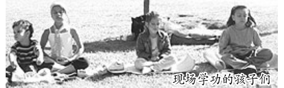
现场学功的孩子们

【慧明网】荷兰鹿特丹一年一度的中国节于2004年8月28及29日在离市中心很近的唐人街举行。这两天欣逢风和日丽、晴空万里的好天气。街上挤满了许多来自荷兰不同城市的游人访客。法轮功学员们带着大法真象资料在唐人街的社区公园里适时的挂起“法轮大法”的横幅，摆出有关在中国发生的迫害真象的各式展板，播放大法音乐及表演优美的功法。