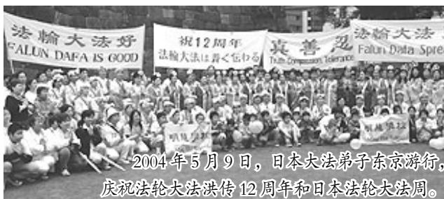
2004年5月9日，日本大法弟子东京游行，庆祝法轮大法洪传12周年和日本法轮大法周。

法轮功作为一种强身健体、提升道德的高层次修炼方法在日本广泛洪传，深受民众喜爱，一直以来都是合法的。早在2002年7月29日，为