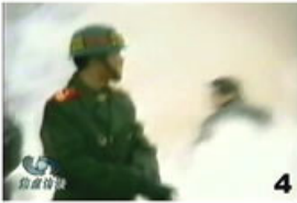
1、刘头部受到一记重击 2、击打后飞出的重物 3、重物飞越人头项 4、击打者仍保持用力姿势

你想想，电视上说 1 分多钟就把火灭了，这可能吗？如果不是提前准备好，哪来的 20 多个灭火器？去过天安门广场的人，谁见过警察背着灭火器巡逻？现场的两辆警车怎能配备这么多灭火器？还有灭火毯哪，警车上也配备吗？摄像人员到位那么及时，真是假戏真作，破绽百出。