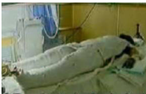
《焦点访谈》中的“自焚者”却被包裹得严密。

稼地里的重活不能干，治病还欠了很多外债。我有两个姐姐，那时家里三个孩子都小，家中重担全落在我娘肩上了，有时我娘就在春天去县城医院打针，以保证地里活忙的时候能坚持劳动。靠着姥姥家的帮助，父母艰难的干着农活，供着几个孩子上学。