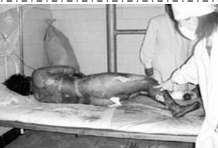
烧伤病人要在空气中暴露，护理人员要穿卫生服，戴口罩以防感染。

新闻工作者： 当时新闻联播一放，我就知道是假的。瞬间就发生的自焚，从始到末都被完整的录下来，并且是全方位多角度，从远景到特写镜头面面俱到。一看就知在造假，我才不信呢！