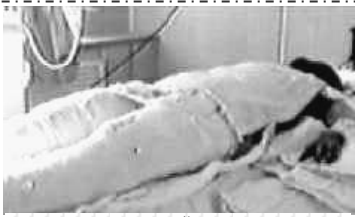
中央电视台“天安门自焚案”中的“烧伤病人”全身包裹。