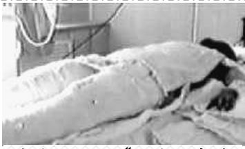
中央电视台“天安门自焚案”中的“烧伤病人”全身包裹。