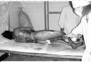
烧伤病人要在空气中暴露，护理人员要穿卫生服，戴口罩以防感染。

新闻工作者： 当时新闻联播一放，我就知道是假的。瞬间就发生的自焚，从始到末都被完整的录下来，并且是全方位多角度，从远景到特写镜头面面俱到。一看就知在造假，我才不信呢！