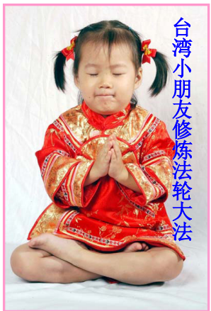
台湾小朋友修炼法轮大法

我们每个人的内心深处都是向往美好的,真心祝愿“真善忍”的种子能在每个幼小的心灵里生根发芽。◇