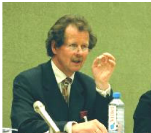
联合国“酷刑问题”特派专员曼夫德·诺瓦可先生

【明慧网】联合国“酷刑问题”特派专员于12月2日结束了他在中国的两个星期的关于酷刑问题的实地调查。于当日在北京召开新闻发布会，世界各大媒体相应抢播报道。