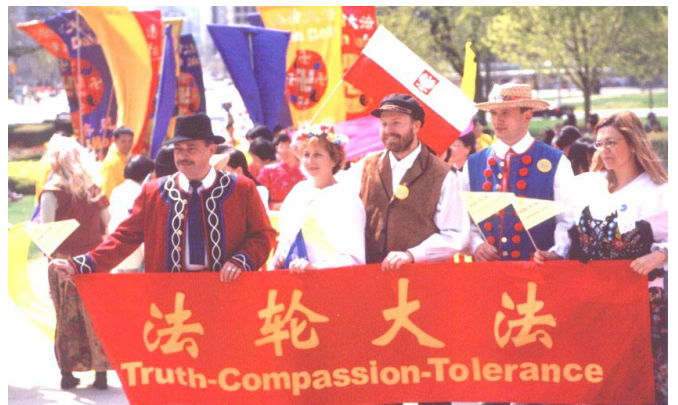
2002 年 5 月 13 日，世界各国法轮功学员欢聚加拿大多伦多市，庆祝“世界法轮大法日”。

世界各国政府、议员、团体组织等纷纷对法轮大法和创始人颁发褒奖及感谢，已达 1223 项。其中美国 1051 项，加拿大 135 项，澳大利亚 12 项，台湾 9 项，中国 99 年以前 6 项，欧洲 6 项，新西兰、日本、印度尼西亚、秘鲁各一项。