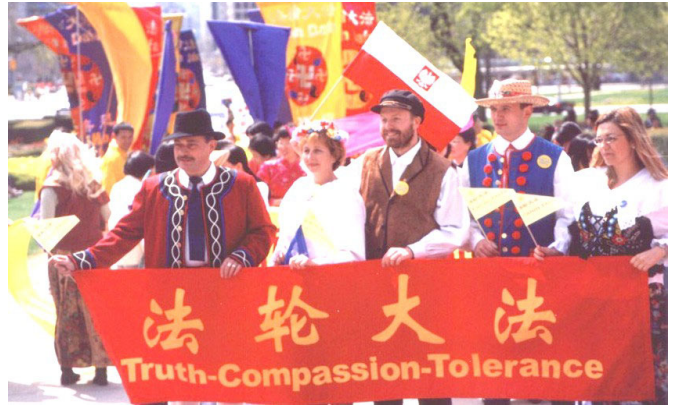
2002 年 5 月 13 日，世界各国法轮功学员欢聚加拿大多伦多市，庆祝“世界法轮大法日”。

世界各国政府、议员、团体组织等纷纷对法轮大法和创始人颁发褒奖及感谢，已达 1223 项。其中美国 1051 项，加拿大 135 项，澳大利亚 12 项，台湾 9 项，中国 99 年以前 6 项，欧洲 6 项，新西兰、日本、印度尼西亚、秘鲁各一项。