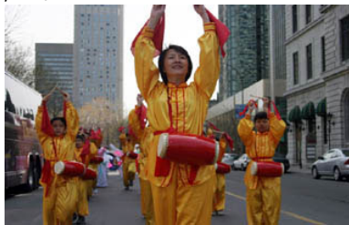
加拿大法轮功学员游行中腰鼓表演

在此之前，美国肯塔基州路易丝维尔市市长对法轮功发布褒奖，并宣布2005年5月13日为“路易丝维尔市法轮大法日”。