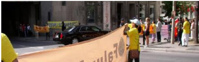
图：胡锦涛的车队从多伦多洲际酒店后面的小路进入酒店时，被法轮功学员迎到

胡锦涛一行于9月10日上午11点左右，绕小道，进入其下榻的多伦多洲际酒店后面的停车场。