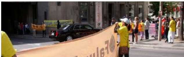
图：胡锦涛的车队从多伦多洲际酒店后面的小路进入酒店时，被法轮功学员迎到

胡锦涛一行于9月10日上午11点左右，绕小道，进入其下榻的多伦多洲际酒店后面的停车场。