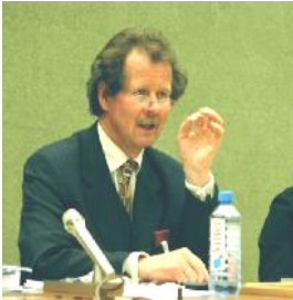
曼夫德·诺瓦可先生

联合国“酷刑问题”特派专员曼夫德·诺瓦可先生于2005年12月2日结束了他在中国的两个星期的关于酷刑问题的实地调查。于当日在北京召开新闻发布会，世界各大媒体相应抢播报道。会上，特派专员谴责酷刑问题在中国非常普遍，而且滥用酷刑遍及全国，中国政府应该遵循国际人权基本准则，以及联合国宪章。中国有着世界上最大的监狱系统，而且常常通过酷刑来迫使无辜的人认罪。