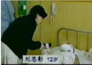
气管切开还能说、唱？记者采访不穿防护服，不戴口罩

大面积烧伤病人的创伤面本应尽量暴露，不能包裹，但央视录像上的“烧伤”者却全身包裹严密，不符合基本的医学常识。记者不穿防护服，不戴口罩，就近距离采访“烧伤病人”。