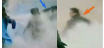
1, 刘春玲头部受重击 2, 打者仍保持用力姿势

重重的造假后面必定是骇人的阴谋！所有“自焚”伪案的参与者，不管动机如何，他们的命运都是苦涩和令人悲哀的。他们失去的，或者是自己宝贵的生命，或者是道德良知。而这场恶毒阴谋的策划者江泽民，为了把法轮功定为“邪教”（因为世界上多数邪教都有自杀的特点），无耻地用毁灭活生生的人的生命为代价，来欺骗世人，煽动仇恨，为对法轮功大开杀戒铺平道路！