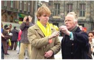
艺术家当即作诗谴责中共暴行

荷兰人民深知第二次世界大战中，纳粹在奥斯威辛集中营杀害一百一十多万犹太人。他们想不到发生在当今中国发生着更残忍的事情——中共活体摘取法轮功学员器官。