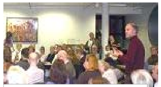
万可润可斯文参议员在发言

媒体都报导了比利时自由党参议员派崔克·万可润可斯文先生针对中共器官交易的调查，以及他得到的令人