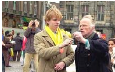
艺术家当即作诗谴责中共暴行

荷兰人民深知第二次世界大战中，纳粹在奥斯威辛集中营杀害一百一十多万犹太人。他们想不到发生在当今中国发生着更残忍的事情——中共活体摘取法轮功学员器官。