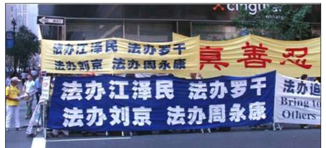
2005年9月，联合国大会元首高峰会之际，海外法轮功学员呼吁停止迫害。

……从即日起，各省市的主要官员及中共头目如再有参与或继续迫害法轮功者，从事新的犯罪行为，一旦其离开中国大陆，将受到世界各地法轮功学员原告的刑事起诉和民事控告，追究其刑事责任，并寻求经济赔偿。”