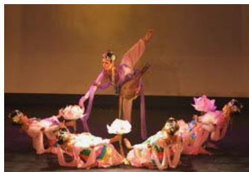
飞天手托花盘、花朵

*北周时代，三五十身的飞天腾空而起，形成浩浩荡荡的歌舞队伍。隋代是飞天创作最生动的时期，形象丰富而充满活力。