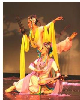
飞天手持各种乐器，演奏、舞蹈

飞天最早见于北魏杨炫之《洛阳伽蓝记》，据说飞天职责各有不同，一是礼拜供奉，表现形式为双手合十，或双手捧花果奉献佛陀、菩萨；二为散花施香，表现形式为手托花盘、花瓶、花朵，或拈花散布；三为歌舞伎乐，表现形式为手持各种乐器，演奏、舞蹈。