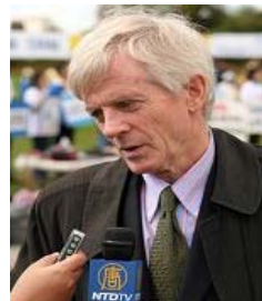
加拿大调查员乔高

【明慧网二零零七年一月十一日】（明慧记者英梓报道）近日，加拿大独立调查员大卫·乔高在渥太华接受媒体采访时表示，在游历三十个国家的首都过程中，已经获得了新的证据证明中共活体摘取法轮功学员器官（下简称：活摘器官）指控的真实性。乔高并表示将最新获得的八至九条新证据加入调查报告，并发表报告的修订本。