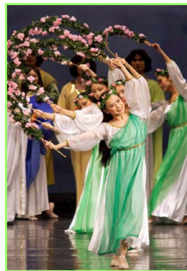
▲舞蹈《誓约》。慈悲的神立誓下世救人，并为人类有得救的机会而欢庆。

很多加拿大政要纷纷表示：“加拿大感到很荣幸和自豪，迎来了全球华人新年晚会这个世界级的音乐舞蹈演出。”