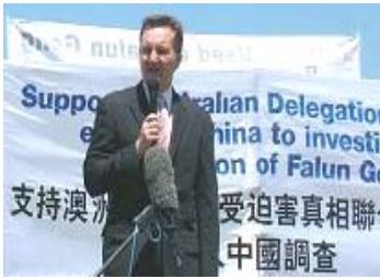
议员克里斯·鲍文说：为什么中国政府不给联合调查团签证。那就是因为活摘器官指控是真实的。

【明慧网】二零零六年十二月十日国际人权日之际，来自台湾、日本、韩国、香港、马来西亚等亚洲国家和地区的法、政、医等各界人士共计九十人，宣布成立“法轮功受迫害真相联合调查团亚洲分团”，该团是继真相联合调查团“澳洲分团”之后的又一区域性调查分团。