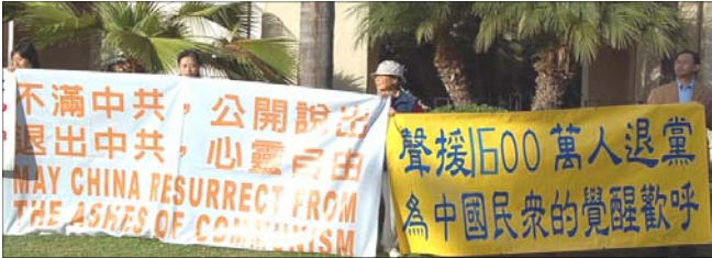
美国圣地亚哥巴博雅公园声援 一千六百万人 脱离中共组织的集会

当前，在中国有越来越多人想要藉由退党的行动来脱离 xx 党的一切罪行，和它划清界线。一些明真相的大陆公安系统、国保系统、610 办公室成员、以及监狱系