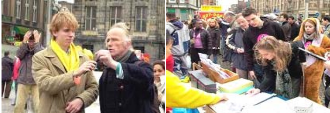
人们等着签字反迫害

界二战中，纳粹在奥斯威辛集中营杀害一百一十万犹太人。他们想不到发生在当今中国发生着更残忍的事情——中共活体摘取法轮功学员器官。人们被迫害的真相所震惊，向学员询问他们可以为法轮功学员做些什么？学员告诉他们：“我们是和平的修炼群体，我们希望每一个人都能了解迫害的真相，站在正义的一边就是对我们的支持。”人们纷纷签名反迫害。一位艺术家听到迫害真相后，在广场上帮助学员们发了一整天资料。他按不住心中的愤慨，当即作诗：“…奥斯威辛集中营搬到了中国，它的烟囱还在燃烧。”