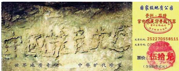
贵州掌布乡风景区门票上的“藏字石”照片，“中国共产党亡”六个大字清晰可见。