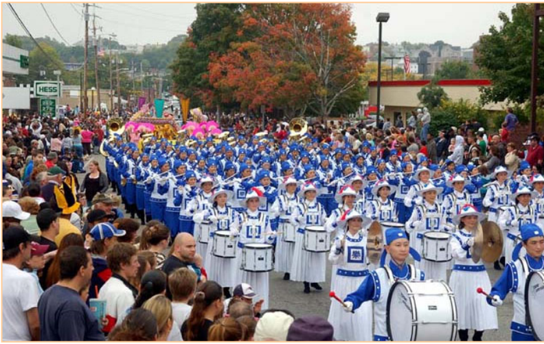
▲ 身穿传统宫廷乐团服饰的天国乐团受到观众的欢迎