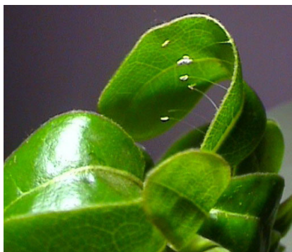
长沙某小学内的优昙婆罗花