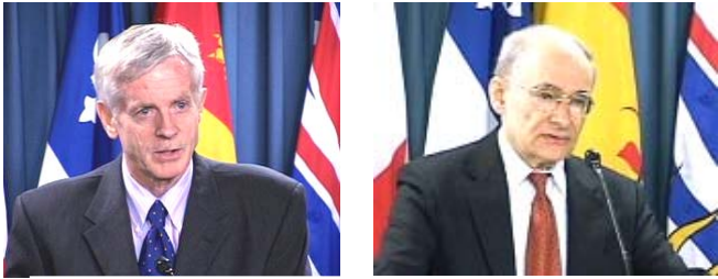
▲加拿大调查员大卫·乔高 和 大卫·麦塔斯

【明慧网】我是个农村人，不知道什么大道理，是我伟大的师尊告诉我怎么样做一个真正的好人，