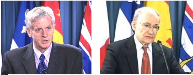
▲加拿大调查员大卫·乔高 和 大卫·麦塔斯

二零零七年一月三十一日上午，两位调查员在首都渥太华加拿大国会，公布了修订后的报告《血腥的活摘器官——加拿大关于中共活取法轮功学员器官调查报告》。 调查报告增补版，加入了更多的直接证据，显示被活体摘取器官的受害者来自法轮功学员，这类活体器官摘取手术，在遍及全中国的医院中一直在进行。 并揭开了一个重要的黑幕：中国军方广泛参与活体摘取法轮功学员器官的罪行。 报告中提供了一个证据：一位前往上海第一人民医院（民用医院）做肾移植手术的证人披露，在两周内院方提供了四个肾，并做了配型测试，发现肾源并不合适；事后，院方又找到了四个肾，有一个配型适合，该受访者接受了移植手术。而“他的术后的八天康复治疗是在中国人民解放