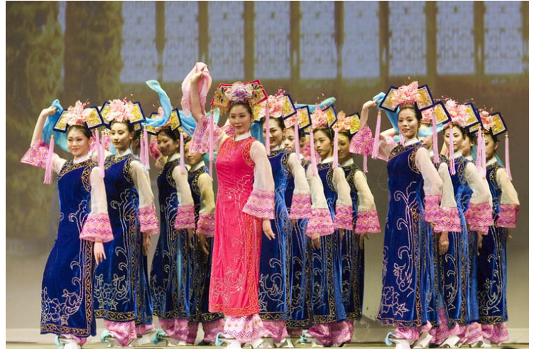
《满族舞》：展现女性的纯净、尊贵与高雅之美