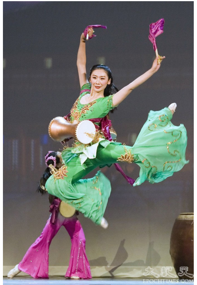
《鼓韵》：悠远鼓声 震撼心灵 开启尘封已久的记忆