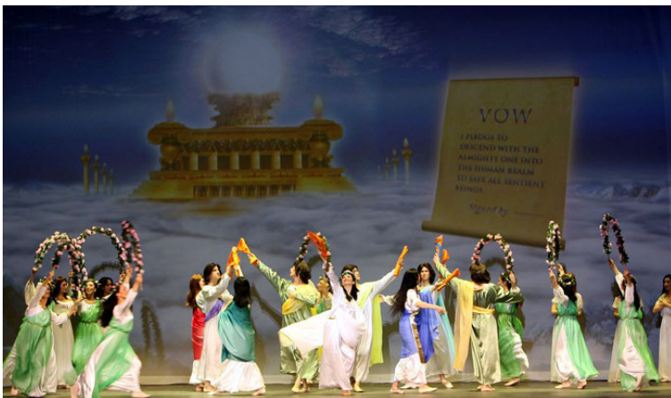
舞蹈《誓约》：众神立下救度众生的誓约