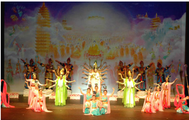
《归位》：讲述了善恶有报的天理