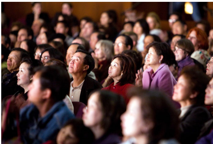
观众被节目深深吸引（美国洛杉矶新唐人晚会现场）

“新唐人晚会节目简约精致，所映射的内涵和阐发的道理却高洁、深远，直指中华神传文化的本质。晚会以对神佛的敬慕、追随和对人生真谛的求索，唤醒人们对生命本源和久远历史的记忆，激起那来自旷古久远的共鸣……。”——专栏作家章天亮