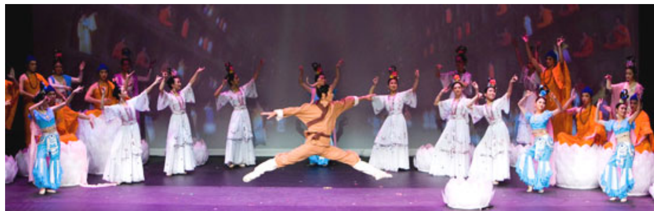
《造像》：讲述了莫高窟「千佛洞」的由来