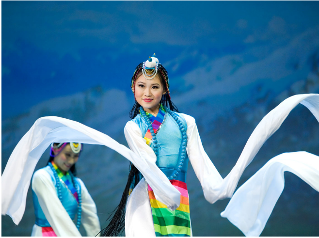
舞蹈《雪山白莲》象征藏族少女的纯洁和善良