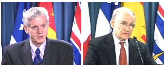
加拿大调查员大卫·乔高 和 大卫·麦塔斯