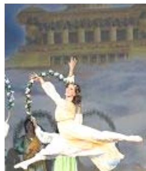
▲舞蹈《誓约》：慈悲的神立誓下世救人，为人类有得救的机会而欢庆。

著名女低音歌唱家杨建生演唱的歌曲之一《天安门广场，请你告诉我》，触动很多观众的内心深处，人对神传文化的直接感受，语言已不是障碍，每场都有观众听后起立鼓掌，东西方观众感动的落泪。