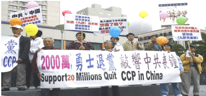
▲三月二十四日旧金山各界庆祝两千万人“三退”