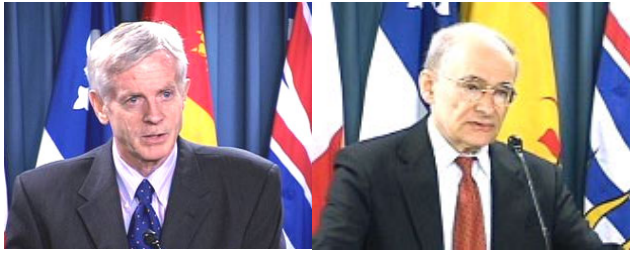
▲加拿大调查员大卫·乔高 和 大卫·麦塔斯

体来源于被迫害的法轮功学员，联合国人权委员会酷刑专员诺瓦克先生要求中共政权在本周内对一系列疑点作出解释。