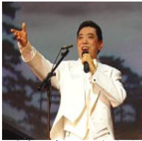
关贵敏在2007年全球华人新年晚会上演出

1983年，39岁的关贵敏歌唱事业正达高峰，却意外发现罹患乙型肝炎兼早期肝硬化。为了治病，他休养一年，四处求医，找偏方，并尝试各种气功，但都未见好转。关贵敏回忆道：“当时身体状态很差，比如领儿子太太到动物园，他们四处走，我走一会