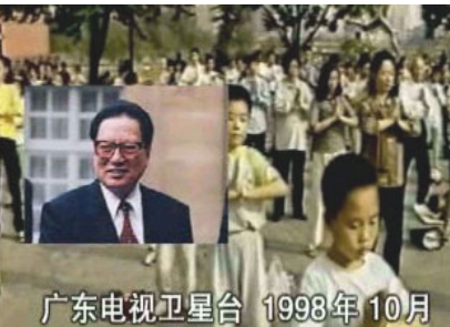
1998 年 10 月关于法轮功的正面报道，其画面中反