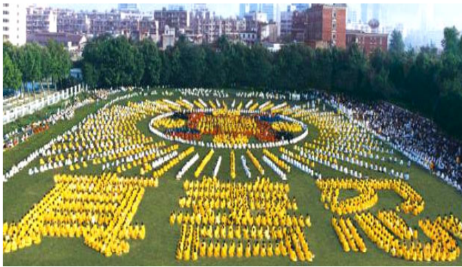
1997 年武汉市 5000 法轮功学员炼功组