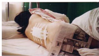
两节腰椎压缩粉碎性骨折