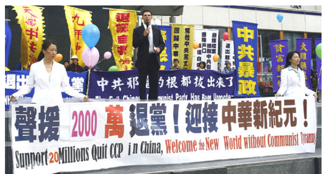
▲三月二十四日旧金山各界庆祝两千万人“三退”