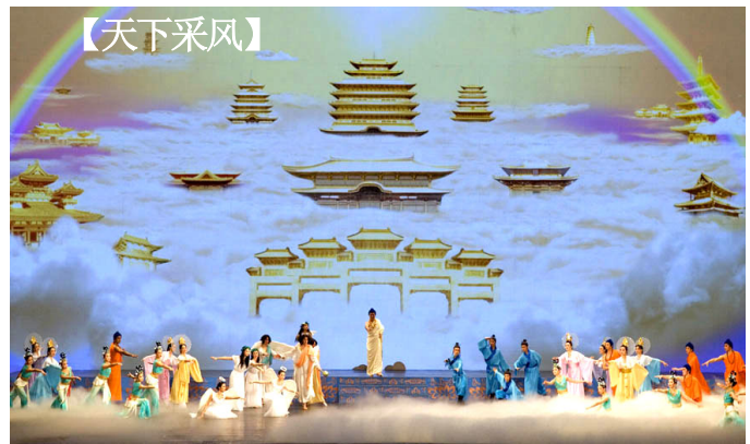
晚会开场节目《创世》：主佛率众神下世，为众生开创美好的未来。