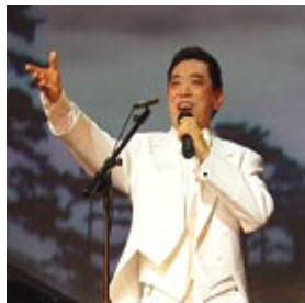
关贵敏在2007年全球华人新年晚会上演出

1983年，39岁的关贵敏歌唱事业正达高峰，却意外发现罹患乙型肝炎兼早期肝硬化。为了治病，他休养一年，四处求医，找偏方，并尝试各种气功，但都未见好转。关贵敏回忆道：“当时身体