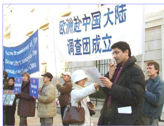
真相调查团欧洲分团二月三日在伦敦中使馆前举行新闻发布会，宣布正式成立。

二零零七年二月十二日，法轮功受迫害真相联合调查团（CIPFG）已经完成在全球四大洲的初步组建工作，四个调查分团已相继成立。他们是： 澳洲调查分团，亚洲调查分团，欧洲调查分团和美国一加拿大调查分团。