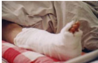
小腿脚踝处开放性粉碎骨折