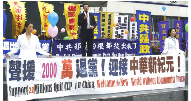
▲三月二十四日旧金山各界庆祝两千万人“三退”