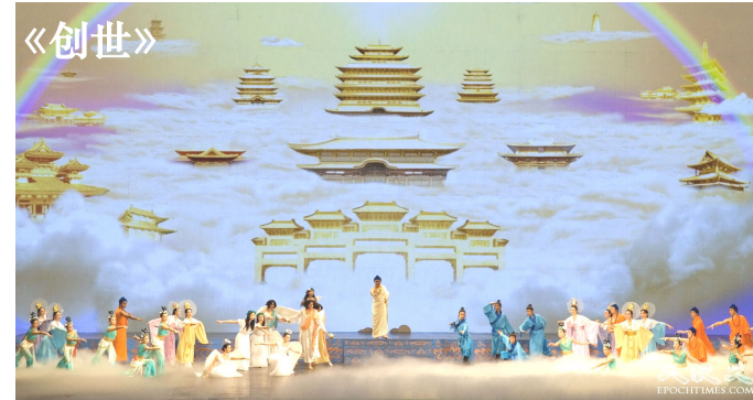
当大幕徐徐拉开，一个辉煌、殊胜的神界天国

的一部分，而这座寺庙只是宁静的接受这一切。皇帝被这庄严的寺庙深深的感动了，胜负也不言而喻。