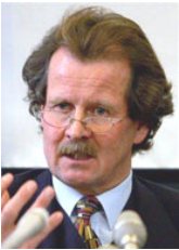
联合国酷刑问题 专员诺瓦克先生

们炼法轮功。二零零六年，大纪元时报报导了中共从活着的法轮功学员身上摘取器官的行径。加拿大调查员人权律师大卫·麦塔斯对此开始展开调查。经过近半年的继续深入调查，收集到更多确认中共活体摘取法轮功学员器官的真实性的证据。乔高说：“自从中共开始迫害法轮功，器官手术的数量快速上升。有四万一千五百例移植手术的器官来源不明。