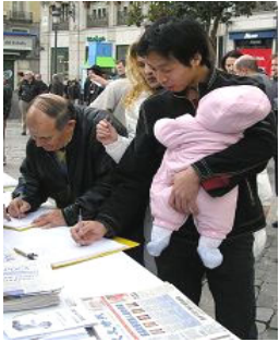
签字声援两千万中国人退出中共邪党

这些记录着中共残害中国人民的图片，触动了人们的内心深处。越来越多的海外中国人在觉醒。