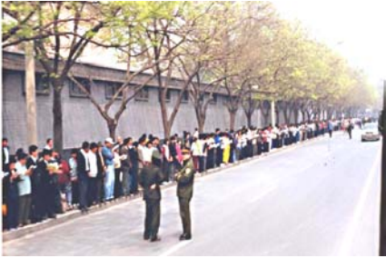
学员没有标语口号，没有阻塞交通。警察无事闲聊天。

4月25日当天，上万名闻讯而来法轮功学员，在上访过程中，既无标语口号，也没有影响交通和民众生活，平静祥和，秩序井然，在北京国务院信访办等候了十几个小时。