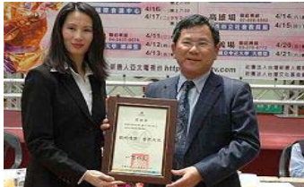
嘉义县长陈明文（右）颁赠感谢状：艺术瑰宝 世界之光

嘉义县长陈明文、市长黄敏惠等对该团以艺术形式宣扬中国传统文化的表现给予高度赞扬，并颁发文化交流感谢状及褒扬金牌等。嘉义市市长黄敏惠说：「嘉义市是艺术之都，欢迎美国神韵艺术团到嘉义市来。目前社会普遍缺乏的是纯正的中国传统文化，神韵艺术团的表演，表现的是中国文化的内涵，一定能使社会的道德回升。」