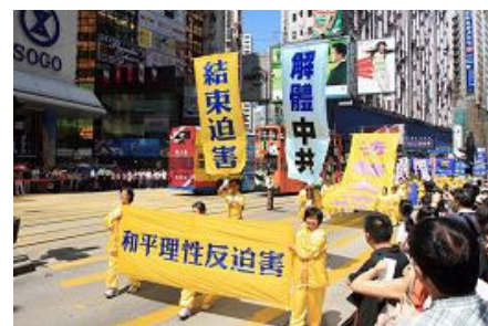
“解体中共、结束迫害”大游行在行进中

【明慧网】二零零七年七月十四日下午，近五百名法轮功学员在香港举行以“解体中共、结束迫害”为主题的集会游行活动，呼吁社会各界声援退党解体中共，结束对法轮功八年的迫害。多名社会人士到场声援，他们谴责中共曾庆红一伙在七一前夕制造群体遣返事件，指出事件显示中共魔掌已伸入香港。支联会主席司徒华发言赞扬法轮功学员的反迫害精神，并指中共政权最害怕有真正信仰的人。前立法局议员冯智活牧师指出，善恶必报是天理，呼吁有关官员立即停止迫害法轮功。