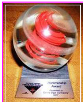
法轮功「大法船」花车荣获最佳「制造工艺」奖

【明慧网】第五十八届“海洋节炬光游行”于七月二十八日晚在西雅图市中心的大道上举行。在现场三十万观众的欢呼声中，在电视机前七十万观众的期待中，法轮功队伍以气势磅礴的二百人阵容，展现了从现代西方文明到东方神传文化、从人间至天国的美好景象。法轮功浩浩荡荡的“天国乐团”令人赞叹不已；恢宏精美的“大法船”更令人叹为观止。电视七台评论员向观众介绍时说，“这是从古老庄严的唐朝直接驶来的法轮功‘大法船’花车。她获得了今年的最佳‘制造工艺’奖，非常绚丽多彩，具有非常的想象力！”◇