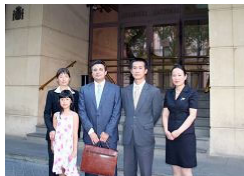
法轮功律师和证人在西班牙国家法院前

【明慧网】二零零七年七月三十日上午，西班牙法官依斯马尔·雷诺（Ismael Moreno）和检察官胡安·戴莫拉（Juan del Moral）在马德里与三位来自不同国家的证人见面，为二零零四年中共官员贾庆林访问西班牙时法轮功学员递交的起诉贾庆林酷刑罪、反人类罪一案调查取证。这三位证人包括来自爱尔兰的赵明、来自澳大利亚的戴志珍和来自法国的陈颖。据原告方律师卡洛斯·伊克雷西亚斯（Carlos Iglesias）说，