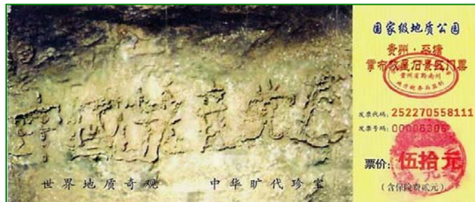
图为贵州省平塘县掌布乡“藏字石”风景区的门票

记预言提到“贫者一万留一千，富者一万留二三”“十愁难过猪鼠年”。所以现在海内外都流传着“天灭中共、三退保命”这句话。《九评共产党》一书让人们看清了中共的邪恶本质，至今已有超过二千五百万人退出了中共的党、团、队组织。面对关乎自己性命的问题，我们怎能漠然视之？无论从古代预言还是从中国现实来分析，选择退出中共都是为自己生命负责的明智之举。