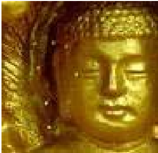
佛像上出现佛家传说中的 的优昙婆罗花

和信徒认为是“优昙婆罗花”开了。而按照佛经的记录，2005 年正是佛家的 3032 年。 今年以来，“优昙婆罗花”更在韩国、台湾、香港、中国大陆、新加坡等多处盛开。这似乎预示着，我们离一个特殊时期越来越近了。 在“优昙婆罗花”开的这个特殊历史时期，玛雅人的古老传说也奇迹般的得以兑现，十三块水晶头骨失而复聚。大祭司阿莱坚德罗称：水晶头骨复聚，是神回来的时候！释迦牟尼曾经预言：在二千五百年后，转轮圣王将下世正法，并要洪传一种不绝世缘的修炼法门。 几乎地球上的所有民族都流传着“神要回来”的古老传说。人类历史其实就是等待、盼望神之归来的历史。那么，神真的要回来吗？他是谁？他回来干什么？ 只要我们注意到：优昙婆罗花正在当世开放的事实，那么我们会惊讶地发现：只差撩开薄薄的一层面纱，世人生生世世期盼着的那个归来者其实已经呼之欲出。