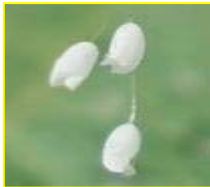
优昙婆罗花放大图

在佛教经典中，记载了有关“优昙婆罗花”的故事。说这种“优昙婆罗花”每 3000 年开花一次，而当花出现的时候，意味着将有转轮圣王在人间正法。