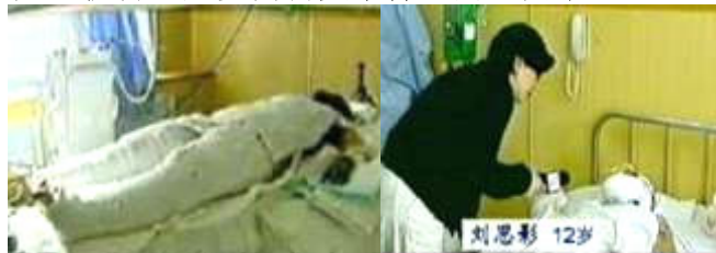
央视《焦点访谈》中的“自焚者”被包裹得严密