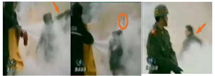
1.刘头部受重击 2.击打后飞出的重物 3.打击者仍保持用力姿势

非法扣除在单位的集资款、养老保险金、过节费及其它待遇、工资及各种钱款等。还有，所有这几年“610”、卫生局各种办班费用（包括：孙运娟、李修梅在罗庄民兵训练基地被痞子折磨、挨打，还得支付给痞子打人的费用）、沂州宾馆、党校、水利技校洗脑班、拘留所、看守所等地办班费用；向北京到处寻找、抓捕费用。总之所有恶人的费用，均让孙运娟、李修梅拿。