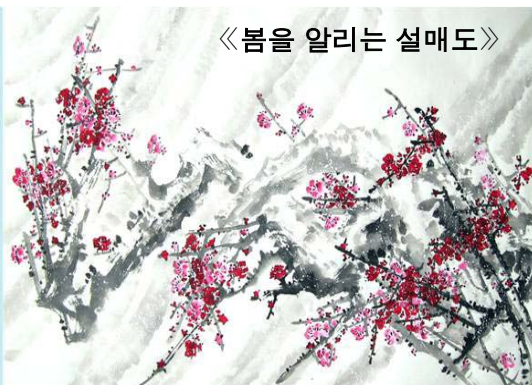
《봄을 알리는 설매도》

그는 1997 년에 북경에 상방갔다는 리유로 로동개조 2 년 판결을 받았고 후에 류리걸식하게 되었다.