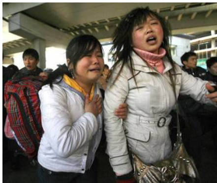
广州火车站，两年轻女性面对混乱的场面无助的哭泣。