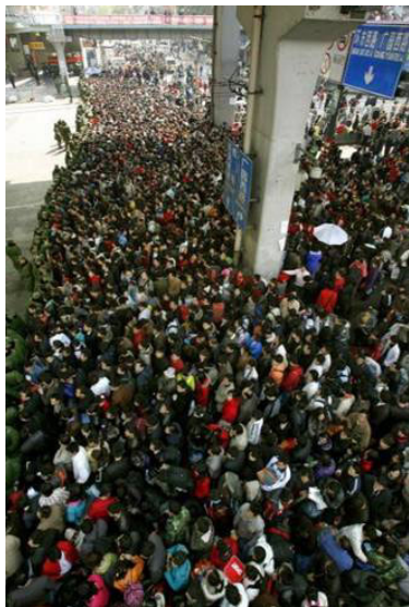
每天都有近30万人滞留的广州火车站