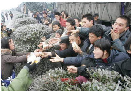
2.7万辆车、8万多名乘客和司机滞留在京珠高速公路湖南境内，有些乘客被困几天没吃东西。图为被困人群抢食品